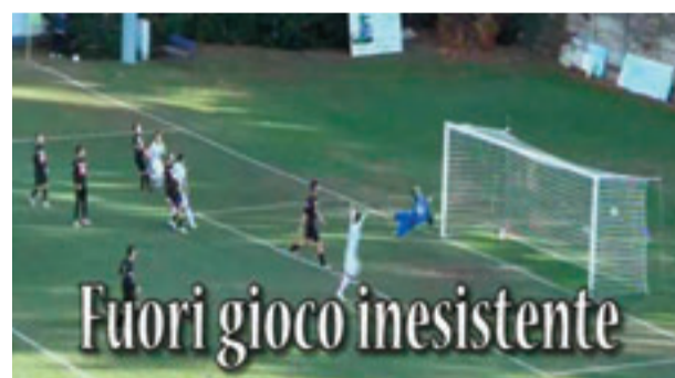
Il fermo immagine del gol annullato al Pinerolo

la tema arbitrale. Domanda? Perché quello che scrivono gli arbitri è oro colato? Per quale ragione capita di incontrare arbitri incompetenti e che colti nella loro incapacità anziché ammettere di aver sbagliato non accettano i reclami? Ma questa è storia vecchia. Storia nuova, invece l'incapacità dell'arbitro di Pinerolo Cheraschese. Sul sito della webTV www.vocepinerolesse.it il filmato dove si vedono gli svarioni arbitrali. E su questo non si discute. Rimane lo sconcerto che i sacrifici delle società sportive (e sono tanti in particolare in questo periodo) possono essere vanificati da arbitraggi scan-