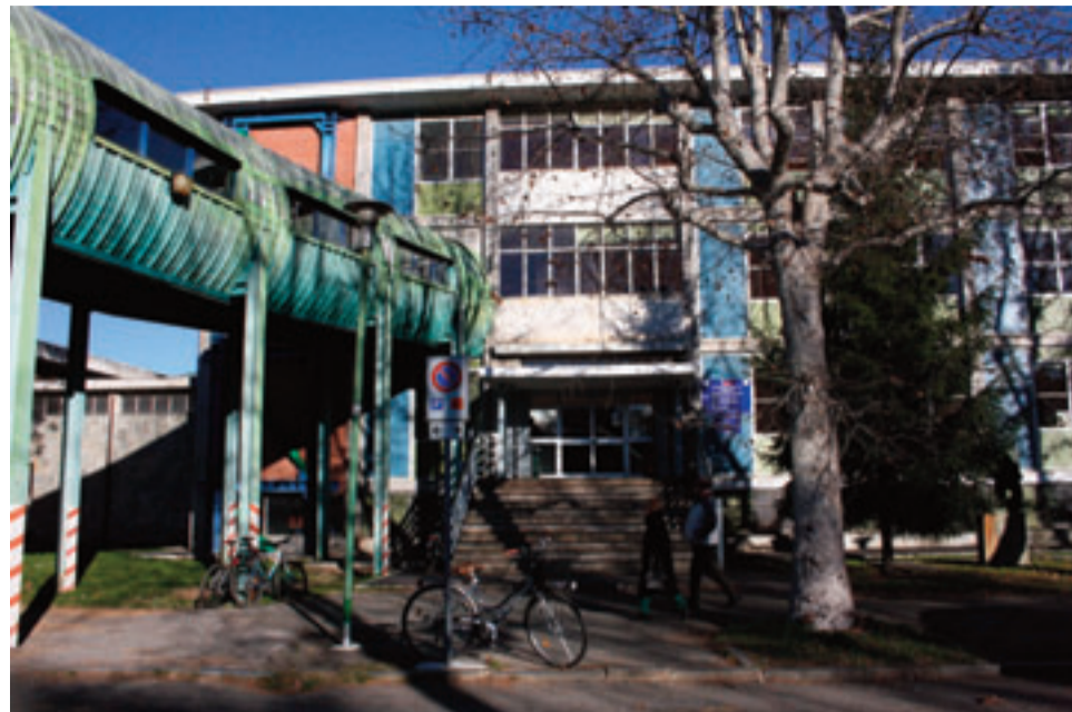
L'istituto Ignazio "Porro" di Pinerolo