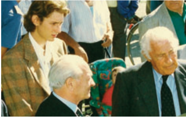
Un giovane John Elkann con il nonno Agnelli e Distaso sempre durante un Concorso Ippico a Pinerolo.

fuori luogo. La motivazione di questa scelta è stata "motivata" dal fatto che sarebbe stato più utile intitolarla a "Federigo Caprilli", il capitano di cavalleria che a Pinerolo ha inventato il metodo naturale di equitazione. Peccato che i "nostri politici" nemmeno sanno, così pare, che a Caprilli è già intitolata quella splendida struttura della "Cavallerizza", per l'appunto, Caprilli. La realtà è che il nome Agnelli "disturba le menti" di chi è impegnato d'ignoranza (ovvero chi ignora) e di ideologie e lotte "contro il padrone" che sono puerili e fuori dalla realtà. Il mondo è andato avanti ma c'è chi è rimasto molto indietro. Ho trovato, politicamente parlando, deplorabile, orribile, una caduta di stile e intelligenza quella che si è manifestata durante il consiglio comunale. Purtroppo c'è chi ha la memoria corta e si dimentica quanto di buono ha fatto, non solo l'avvocato Agnelli ma tutta la sua famiglia, per il pinerolese. A parte la creazione di posti