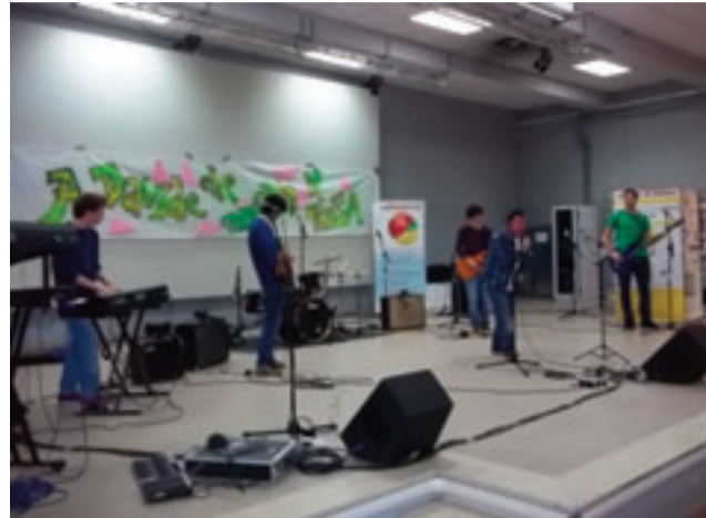
Un momento della manifestazione

Sabato 24 novembre si è tenuto il concerto finale del ciclo d'incontri “Anche io posso”, l'iniziativa volta alla sensibilizzazione verso i problemi delle persone disabili ed al confronto con i normodotati. Rivolto ai giovani, l'evento si è svolto nell'auditorium del liceo scientifico Curie; otto i gruppi partecipanti, tutti composti da giovani ragazzi liceali ed universitari. “Il concerto è rivolto principalmente ai giovani - ha detto Blind Reverendo, musicista non vedente pinerolese, apprezzato anche all'estero - sono loro la chiave di tutto. Questa città ha bisogno di svegliarsi, la musica è fatta ormai solo da persone adulte, mentre viene lasciato poco spazio ai giovani. Per questo ho vo-