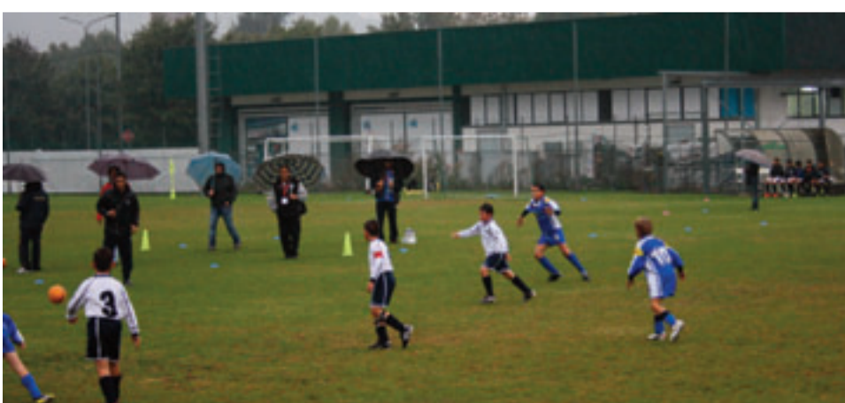
Il settore giovanile del Pinerolo. Avanti anche sotto la pioggia

Squadre partecipanti: Ben 8 le compagini partecipanti: Juventus, Siena, Torino, Empoli, Bassano, Pinerolo FC Blu, Pinerolo FC Bianco e Vicus. Un torneo di qualità che ancora una volta dimostra come la società del Pinerolo FC ha grandi progetti e importanti attenzioni per il proprio settore giovanile.