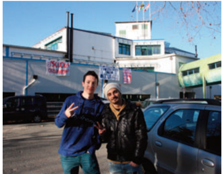
Nella foto l'ala Ovest dell'istituto Porro di Pinerolo che è stata occupata

L unedì scorso 10 dicembre, alcuni studenti dell'Istituto "I. Porro" di Pinerolo (e alcuni anche all'Istituto "Alberti" di Luserna San Giovanni), hanno occupato una parte dell'edificio scolastico, l'ala Ovest. Gli studenti hanno fatto autogestione ed alcuni hanno anche dormito nella scuola. Una manifestazione nata dall'esigenza di far conoscere ulteriormente la grande difficoltà della scuola a seguito dei tagli ai finanziamenti e il problema delle classi sovraffollate. Inoltre la protesta non è stata assolutamente contro gli insegnanti né contro la dirigente scolastica Gabbri. Inoltre la prote-