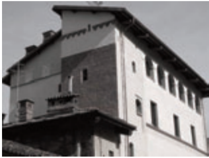
Cavour - Il Palazzo dei Principi d'Acaja

dagli avvenimenti relativi ad un'aspra "contesa" tra queste ultime due casate che prende avvio