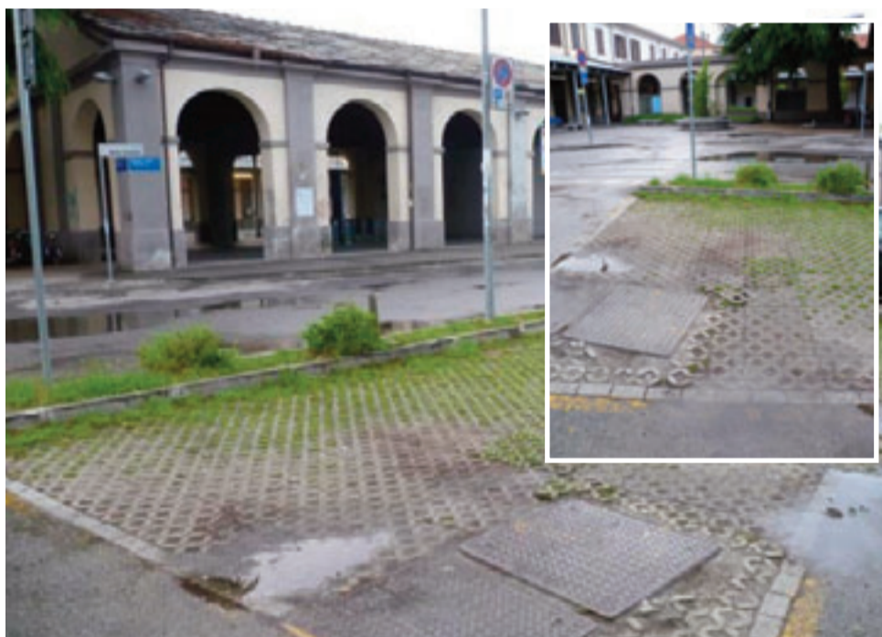
Nelle foto il parcheggio alla stazione di Pinerolo. Nel riquadro il particolare. Nessuna striscia e pavimentazione "impossibile" con l'uso di una sedia a rotelle.