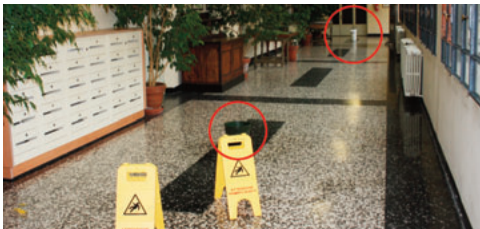
Nella foto, nei cerchi, i due secchi sistemati sotto la copertura di vetro cemento.

L a pioggia dei primi giorni di dicembre ha nuovamente messo in luce un problema: piove all'interno del Palazzo Comunale. I cittadini che hanno attraversato il corridoio, al primo piano, hanno visto secchi sul pavimento e udito i "plin, plin" delle gocce d'acqua che cadevano dalla copertura di vetro cemento all'interno dei secchi. "Piove, governo ladro..." questi alcuni commenti. Qualche giorno dopo è stata messa una toppa al problema. E' stata distesa una guaina catramata sopra la copertura di vetro cemento. Addio luce e problema rinviato!