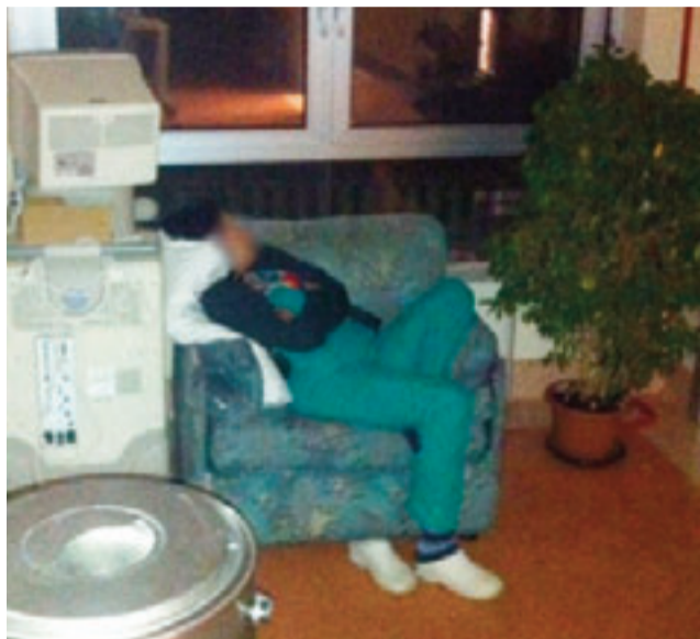
L'infermiera dorme beata con tanto di cuscino... (Il volto è stato sfocato per scelta redazionale.)

"Il mese scorso il (omissis) hanno ricoverato d'urgenza mio papà al pronto soccorso dell'ospedale "Agnelli" di Pinerolo. Dopo una lunga giornata trascorsa in pronto soccorso, la sera, intorno alle diciannove mio padre viene trasferito nel reparto (omissis). Verso le ore 23 mi chiamano a casa perché mio papà era molto confuso e agitato, e siccome il reparto è sotto organico, mi viene chiesto di passare la notte per evitare cadute dal letto con, eventuali possibili fratture del femore. Una volta in ospedale chiedo spiegazioni in merito alla mia convocazione al medico di turno, che mi ribadisce la carenza di personale e in modo gentile mi conferma che, per il bene di mio papà, sarebbe importante la mia presenza. Così fac-