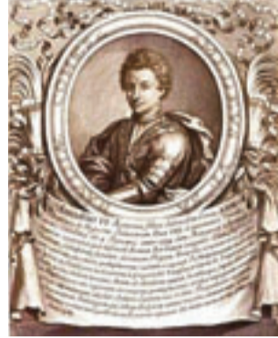
Conte Verde Savoia