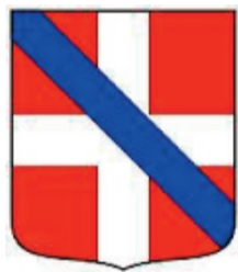
Stemma Savoia Acaja

mento di truppe. Ma perché questa particolare attenzione? Cosa minacciava il castello di Cavour? Il possibile nemico era, questa volta, davvero inusuale, non si trattava, infatti, di guardarsi dalle abituali scorrerie dell'eterno nemico, il Marchese di Saluzzo, bensì dai soldati di Amedeo VI di Savoia, il conte Verde, cugino e superiore feudale degli Acaja. Una contesa, quella scoccata tra i Savoia del ramo comitale ed i cugini Acaja, signori del Piemonte e di Cavour, iniziata quando il giovane Giacomo di Savoia Acaja fu costretto nel 1344 a prestare omaggio feudale al cugino il conte di Savoia Amedeo VI. Mal sopportando questo vassallaggio, Giacomo d'Acaja, fingendo d'ignorare il giuramento di sottomissione, nel 1355, chiese personalmente all'Imperatore Carlo IV di essere riconosciuto come vassallo "diretto" dell'impero. L'Imperatore, allettato da una ricca somma offertagli dal principe, concesse il 26 aprile del 1355 all'Acaja, un diploma che gli attribuiva il diritto di battere moneta, creare notai, imporre pedaggi. In realtà, si trattava di un semplice "contentino" che non svincolava completamente Giacomo dai doveri di vassal-