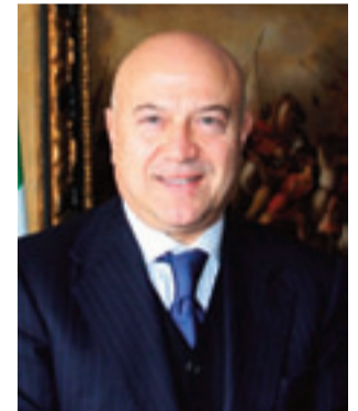
L'Ambasciatore d'Italia nel Principato di Monaco

L'Ambasciatore d'Italia nel Principato di Monaco, dott. Antonio Morabito, ci ha ospitati nella sede dell'Ambasciata a Montecarlo. L'Ambasciatore ci ha concesso un'intervista che qui di seguito pubblichiamo solo una parte. L'intervista completa e integrale la si può vedere nel video nella WEBTV di www.vocepinerolesse.it