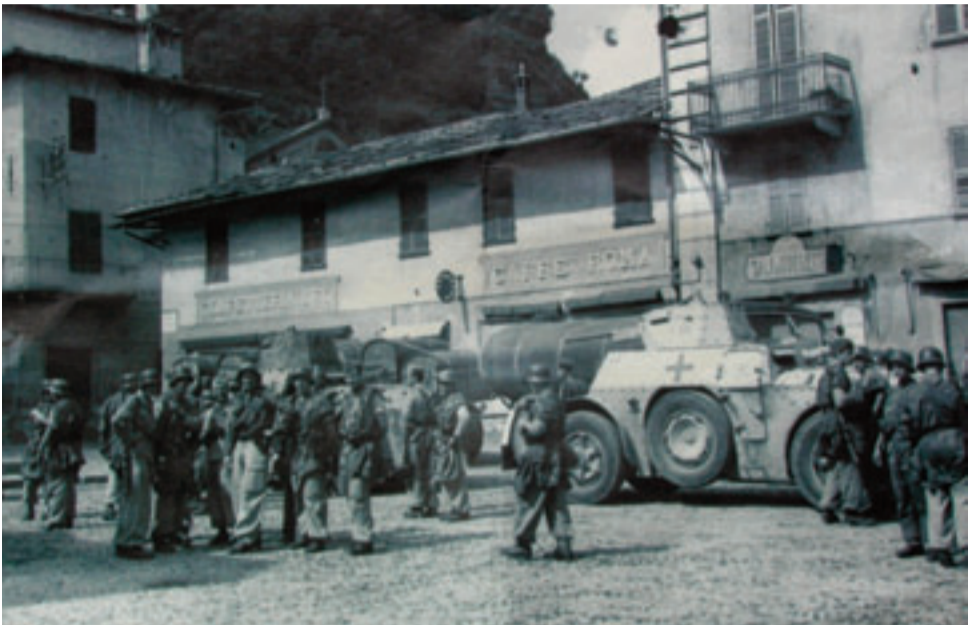
Soldati Tedeschi a Cavour