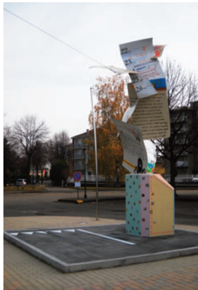
Il monumento alle vittime della strada

È stato inaugurato il 18 novembre scorso in Piazza don Milani il monumento "In Memoria delle vittime della strada" che l'Associazione Ali d'Argento Onlus ha voluto donare alla Città di Pinerolo. Si tratta di un'opera realizzata senza nessuna forma di contributo pubblico: quest'opera, infatti, è stata portata a termine grazie alle numerose persone ed aziende del pinerolese (e non solo) che hanno contribuito mettendo a disposizione non solo denaro ma anche il materiale e la manodopera necessaria alla completa costruzione della scultura. Il monumento, con la scelta di raccogliere testimonianze molto semplici di giovani adolescenti è voluta per due ragioni: la prima è il coinvolgimento attivo degli stessi in un'opera pubblica, la seconda è per rammentare agli stessi l'importanza della riflessione sui propri comportamenti, affinché non sia un uso scorretto di un veicolo a motore o l'uso di sostanze alteranti (droga, alcol) a porre fine ai loro sogni di vita o a quelli di un altro essere umano. Non esiste opera d'arte che possa rappresentare il dolore di un genitore che ha perso un figlio: quest'opera vuole pertanto essere, dopo profonde