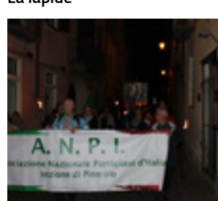
Striscione che "guida" la fiaccolata