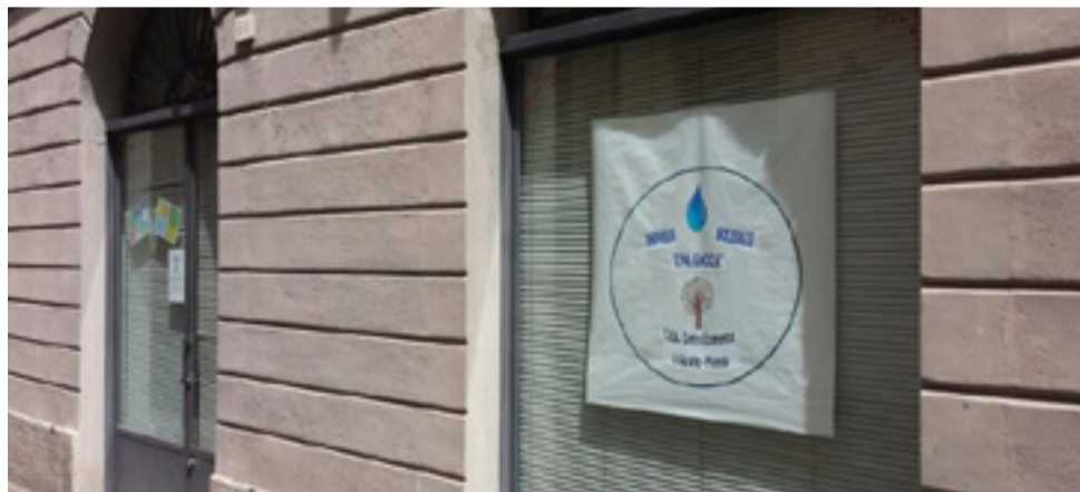
L'emporio solidale del centro ecumenico di ascolto "Una Goccia" in Via del Pino, 61 - Pinerolo. Presenti volontari cattolici e valdesi

Intirizzito dalla pioggia battente, m'infilo nello studiolo di don Virgilio Gelato, responsabile della Caritas diocesana con sede a Pinerolo. Il sacerdote mi travolge di dati e realtà della Caritas pinerolese, «e della Val Noce!», come intende sottolineare, con le parrocchie di Frossasco, Roletto, Cantalupa. Con don Gelato vogliamo fare il punto sulla realtà locale in un momento di grande crisi economica come quella che stiamo attraversando.