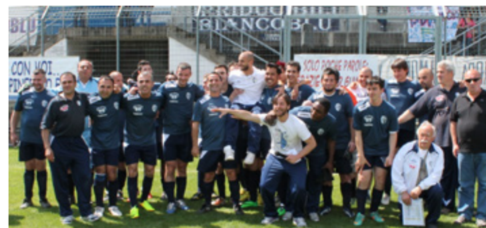
La formazione campione del Pinerolo F.D.