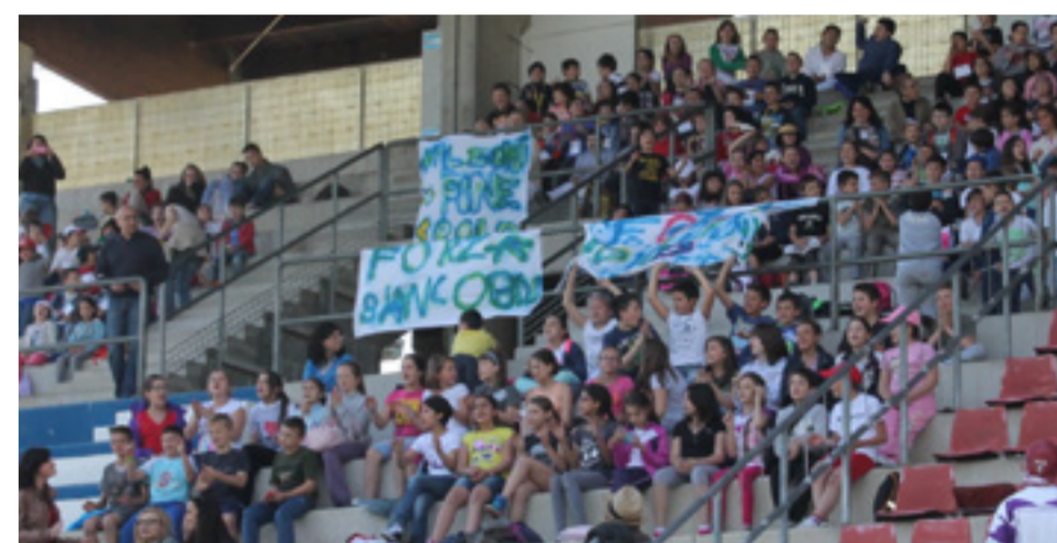
I tifosi scatenati

I ragazzi vincono di nuovo il campionato, ma il vero obiettivo rimane sempre la diffusione della loro esperienza in tutta Italia e nel mondo.