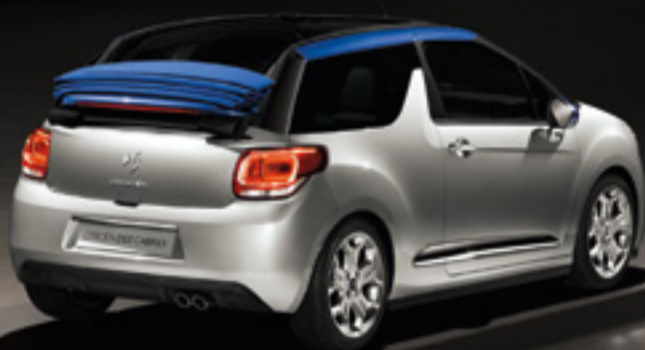
CITROËN DS3 CABRIO