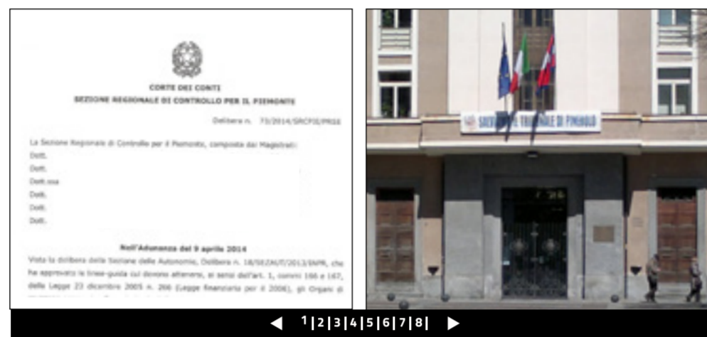
La parte della prima pagina del documento della Corte dei Conti - Il comune di Pinerolo Nella fotogallery su www.vocepinerolese.it il documento completo della Corte dei Conti