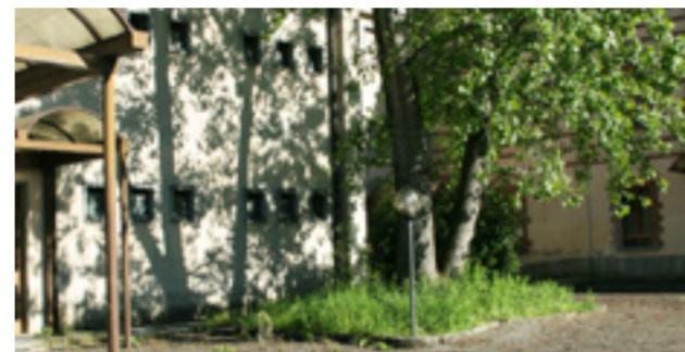
Nella foto, di Enrico Noello, l'erba alta all'interno del cortile dell'ex Istituto in stato di abbandono

peccato che una struttura del genere venga lasciata completamente a se stessa. Ci auguriamo che con le nuove elezioni amministrative del 25 Maggio, il nuovo sindaco e i relativi assessori che verranno eletti possano trovare una soluzione perché, con la chiusura dell'Istituto "Alberti", non solo si è perso un importante punto di riferimento per l'istruzione in valle, ma uno stabile che, dal punto di vista edilizio, avrebbe tutte le carte in regola per essere riutilizzato, rischia di essere dimenticato per sempre.