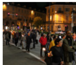
Durante la fiaccolata