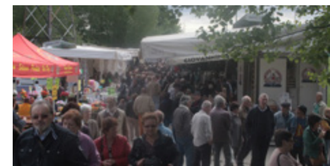
Nella foto, di Enrico Uniarte, le moltissime persone presenti alla fiera commerciale nella zona bersaglio.

del paese, si è tenuto anche il Tour del Gusto. Un grazie comunque sempre è doveroso rivolgerlo proprio alla pro-loco che, nonostante il taglio delle risorse e della crisi, riesce sempre a organizzare eventi piacevoli e turisticamente attraenti.